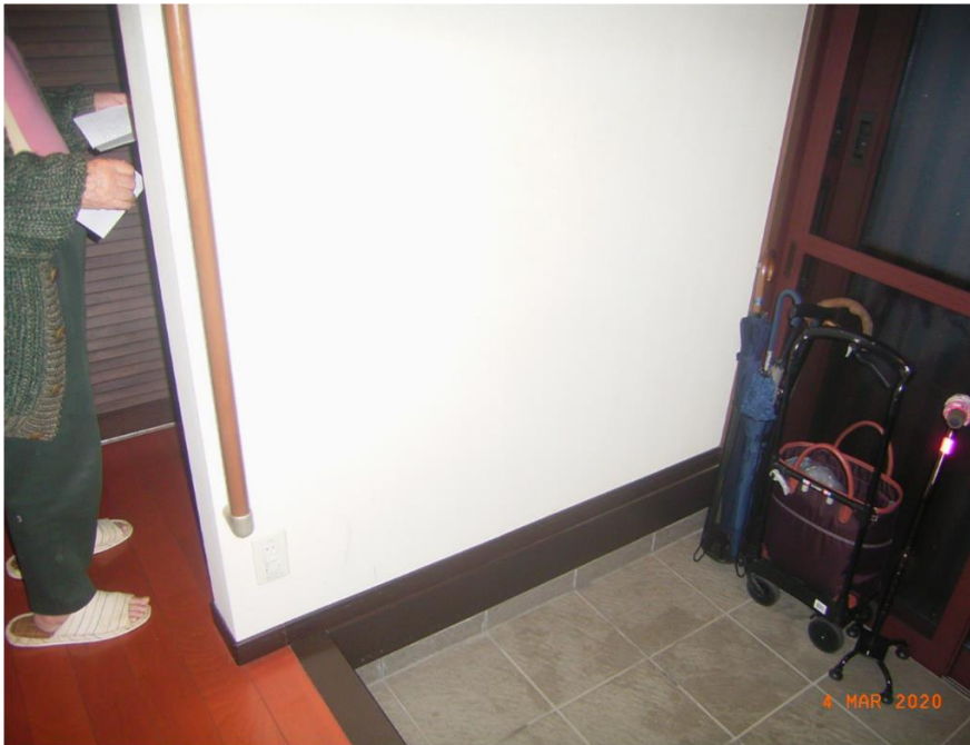
■現状写真■ (工事施工前)